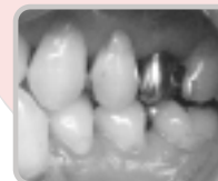
ワンタフトブラシ+3列ブラシで磨いた場合。